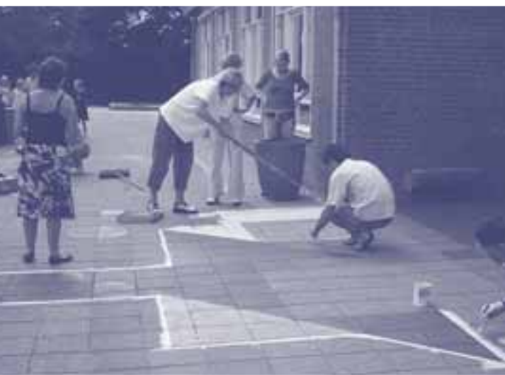
De tangramfiguren krijgen vorm

Eén van de activiteiten was een tegel-sponsoractie. Binnen het Klimteam, de coördinerende groep ouders, was het plan bedacht om de 'oprit' naar de voordeur van De Schalm met twee tangramfiguren op te vrolijken. Voor niets gaat de zon op, maar ontstaan er geen tangramfiguren. Er moest dus