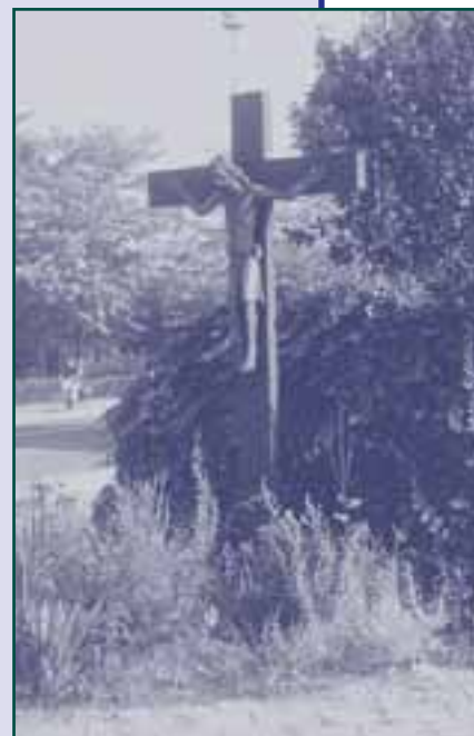
Het bijna totaal overwoekerde kruis

Het is niet helemaal duidelijk wie de zorg heeft over het kruis bij Quatre Bras. Er is zelfs een straat naar genoemd (Kruisstraat) maar nog even en het wordt overwoekerd door het onkruid. Is het de Stichting Kruisen en Kapellen die de zorg over dit kruisbeeld heeft of is het geadopteerd en is de adoptiepersoon vertrokken. Laat iemand opstaan om de zorg over te nemen (de stichting Kruisen en Kapellen dus).