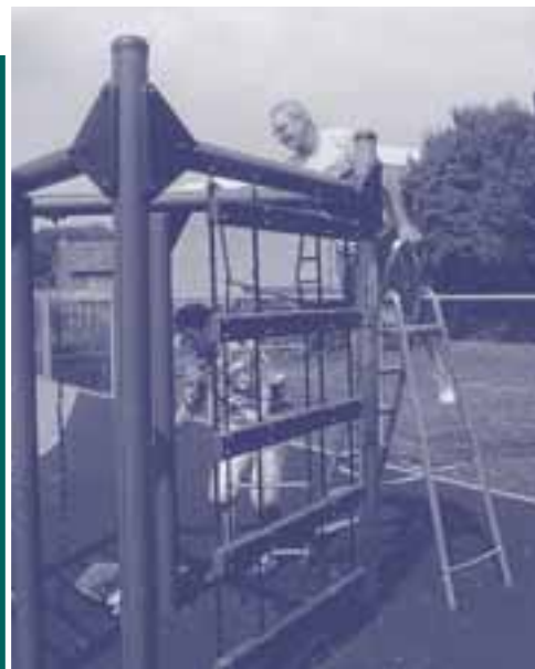
Ook het klimrek wordt onder handen genomen

gesponsord worden. En dat werd dan ook massaal gedaan. Misschien ligt er bij u thuis ook nog wel een afbeelding van deze figuren met daarop precies aangegeven welke tegels 'van u' zijn!