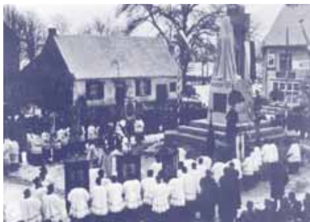
De Zaaier vlak voor de onthulling