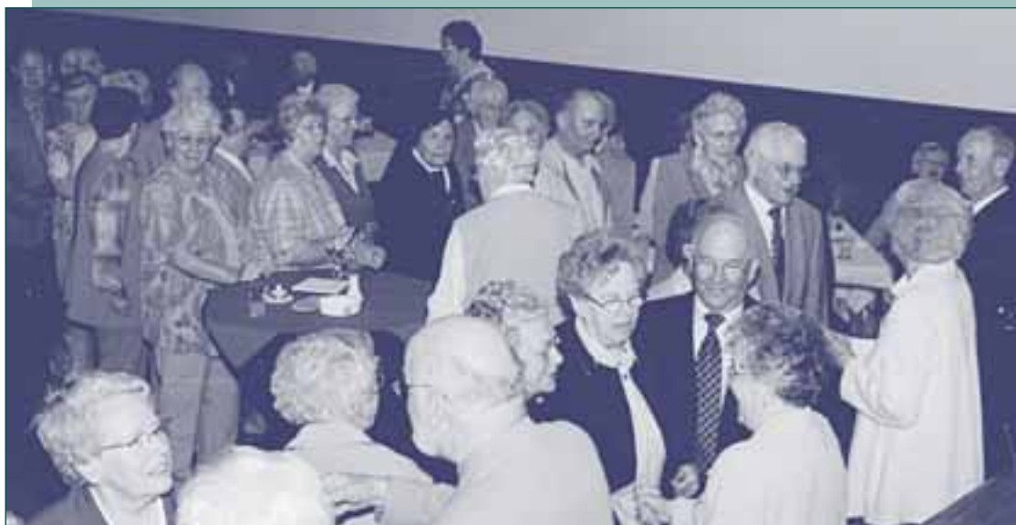
Mei 2004 Viering 40-jarig bestaan

Jongere senioren vanaf 55 jaar zijn nodig om het stokje van de oudere senior over te nemen. U kunt zich als lid aanmelden bij het bestuur van de KBO Sint Rochus Steyl, telefoon 3732972.