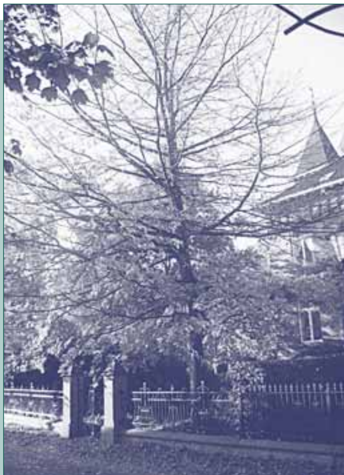
Moeraseik St. Michaelstraat